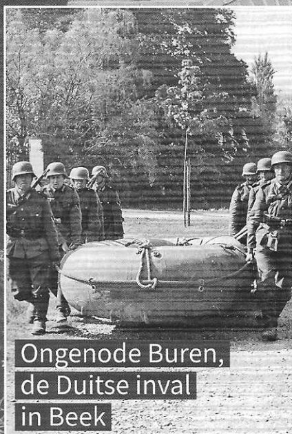
Ongenode Buren, de Duitse inval in Beek