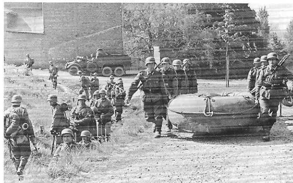
Duitsers steken per rubberboot bij Elsloo het kanaal over

Aangezien diverse bruggen zijn opgeblazen moeten extra (rubber) boten en drijvende pontonbruggen worden aangevoerd, hetgeen veel tijd kost. Zo is de pontonbrug pas om 1.00 uur de volgende dag klaar voor gebruik. De bestaande veerpont over de Maas van Elsloo naar Kotem in België komt goed van pas. Nu kunnen ook grote voertuigen en kanonnen de oversteek maken en kan de divisie haar opmars voortzetten in België. Wel met 36 uur vertraging.