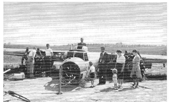
Fam. Demandt uit Beek bij gecrasht Duits toestel

Naast het neerkomen van de bommen zijn er spannende momenten als er vliegtuigen in de buurt