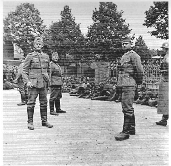
Krijgsgevangenen, Raadhuispark Beek

Voor het eerst verschijnen op 18 mei ook SS'ers op doortocht in Beek, die alle wegen in de buurt blokkeren met hun voertuigen en zware wapens. Britse