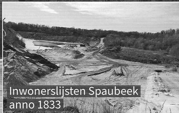
Inwonerslijsten Spaubeek anno 1833