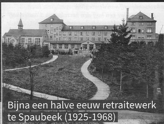
Bijna een halve eeuw reitawerk te Spaubeek (1925-1968)