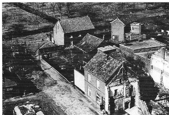
Een unieke luchtopname van Beek vanuit de kerk-toren. Maart 1943. Zichtbaar is het gebied rondom de huidige markt. Duidelijk herkenbaar zijn de gevolgen van het grote bombardement.