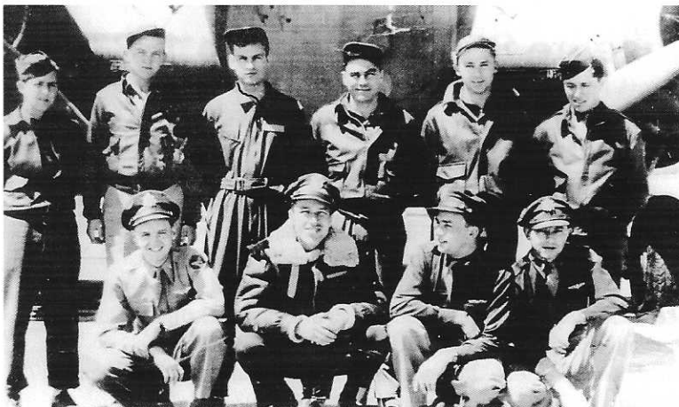
De bemanning van de gecrashte bommenwerper

Op 7 november is het weer prijs. Boven Kerensheide, dan nog behorende tot de gemeente Beek, vliegen 's morgens Amerikaanse bommenwerpers richting hun doel in het Duitse Düren. De Amerikanen hebben de gewoonte om ongeveer tien minuten vóór het doel de bomluiken alvast te openen.