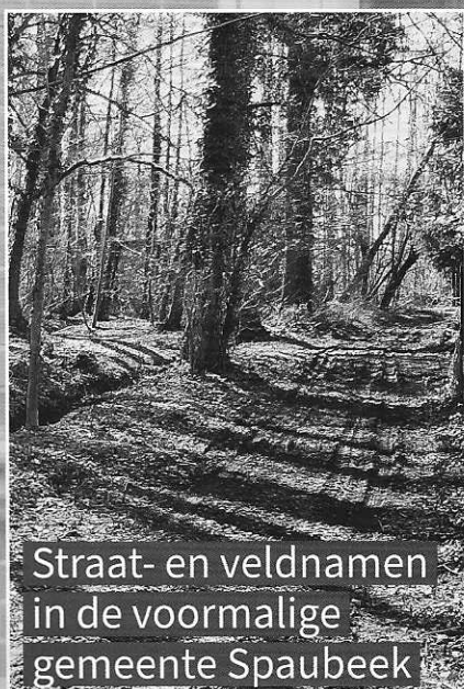
Straat- en veldnamen in de voormalige gemeente Spaubeek