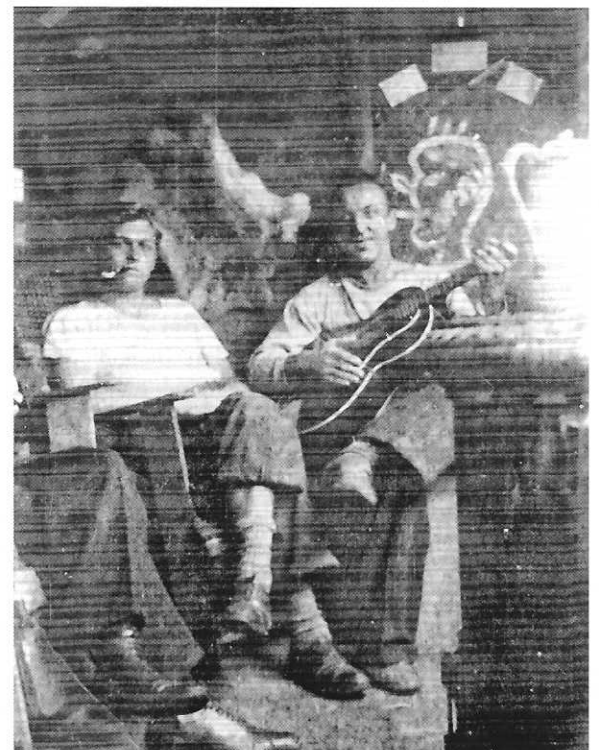
De ondergedoken piloten.

In de loop van 1943 nemen de Engelse luchtaanvallen op Duitse steden en industrie centra drastisch toe. Naast de Engelse nachtvluchten worden de Beekse bewoners steeds vaker geconfronteerd met Amerikaanse toestellen, die overdag richting oosten vliegen. Ze koersen hoger dan hun Engelse collega's, maar zijn bij helder weer goed te herkennen aan de condens strepen van de motoren. In de meeste gevallen vliegen de geallieerde toestellen alleen maar over zonder schade aan te richten. Maar steeds vaker gaat het luchalarm af, hetgeen voor veel onrust zorgt. Ook belanden er 'verdwaalde' of vroegtijdig afgeworpen bommen in de omgeving van Beek. Gelukkig blijft de materiële schade beperkt tot boomgaarden of veldvruchten en resteert alleen de schrik. Maar met de toename van het geallieerde luchtverkeer boven Zuid-Limburg, neemt ook het aantal gecrashte geallieerde en Duitse toestellen in de buurt toe. Alleen al in 1943 zijn dat er bijna twintig en in 1944 bijna vijftig. De kans, dat er ook één op Beek valt neemt zienderogen toe.