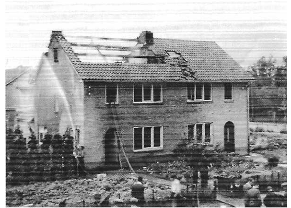
Beschadigd huis in Neerbeek

Een aantal maanden voor de bevrijding, crasht op 20 mei 1944 een Amerikaans toestel in Neerbeek. Het toestel keerde net terug van een mislukte missie bij Luik en heeft al zijn bommen geloosd. Vlak daarna wordt het door Duits luchtafweer geraakt.